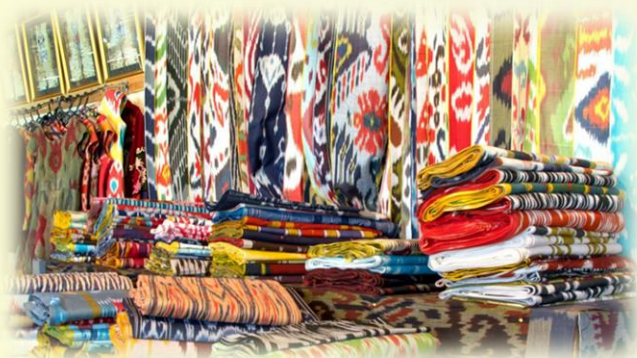
O'zbekiston ipakdan yasalgan atlas va adras