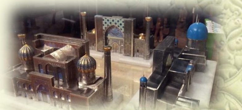
Registon maydonining maketi (Samarqand) AQSH, Nyu-York shahrida BMT tashkiloti binosida joylashgan