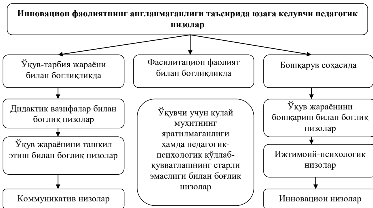
1-расм. Таълимни ахборотлаштириш шароитида инновацион фаолиятнинг анланмаганлиги таъсирида юзага келувчи педагогик низолар.

Конфликтологик маданиятга доир тадқиқотлар таҳлили уни умуммаданият (касбий, психологик, корпоратив)нинг муҳим компоненти сифатида кўриб чиқиш лозимлигини кўрсатди.