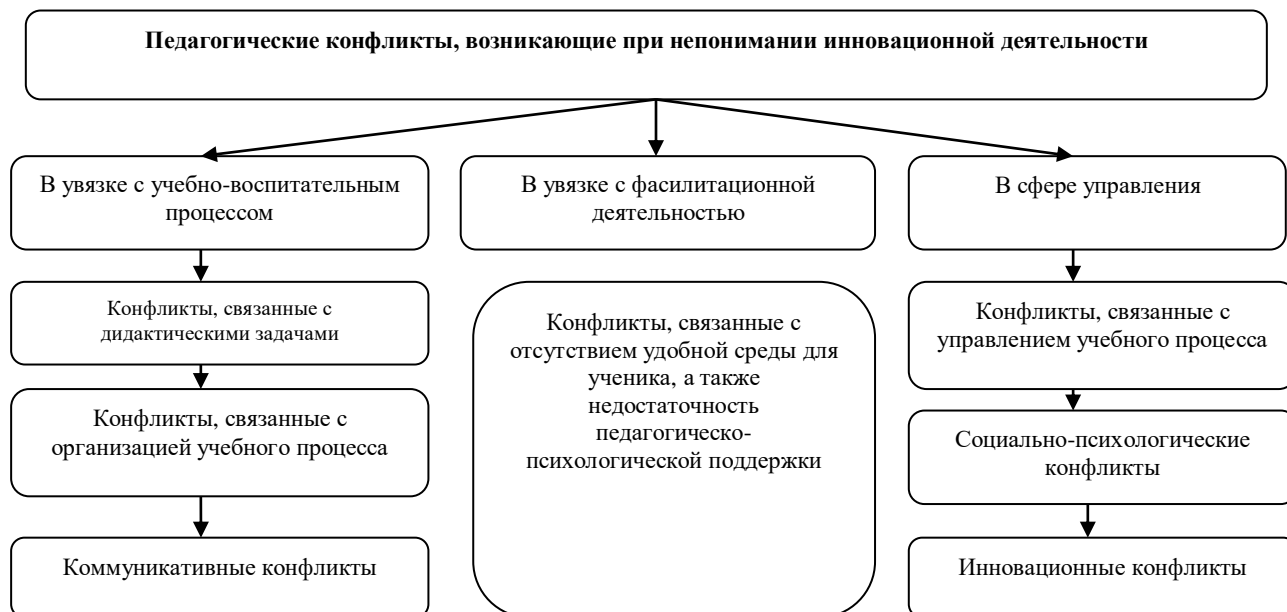
1-рисунок. Педагогические конфликты, возникающие вследствие непонимания инновационной деятельности в условиях информатизации образования.

В контексте информатизации образования выявлены следующие типы конфликтов, появляющиеся в результате ненаправленности инновационной деятельности учителя (рисунок 1).